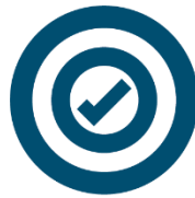
GOOD WATER QUALITY STATUS