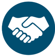
GOOD WATER GOVERNANCE

Ini dicapai dengan melibatkan situs pemakaian air dalam memahami dan mengatasi tantangan air tangkapan bersama serta risiko dan peluang air lokasi. Ini meminta situs yang menggunakan air untuk mengatasi tantangan ini dengan cara yang secara progresif menggerakkan mereka ke praktik terbaik dalam hal lima hasil: