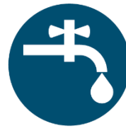
SAFE WATER, SANITATION AND HYGIENE FOR ALL (WASH)

Dalam mengejar hasil ini, implementasi Standar mendorong pendekatan kolaboratif yang melibatkan bisnis dan industri, pemerintah dan masyarakat serta organisasi masyarakat sipil.