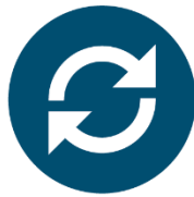
SUSTAINABLE WATER BALANCE